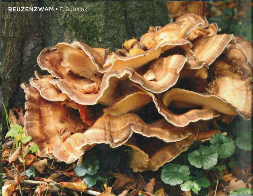
REUZENZWAM • F. Buissink